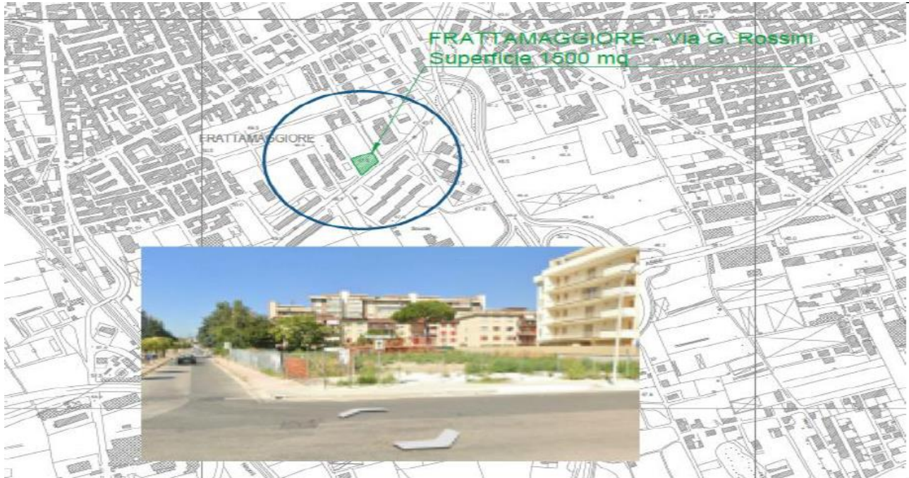
Figura 1. Collocazione territoriale area di intervento

Si riportano di seguito alcune foto aeree per l'individuazione dell'area oggetto dell'intervento.